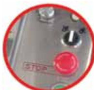
intuicyjny panel operatora