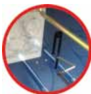
automatyczne wprowadzanie taśmy